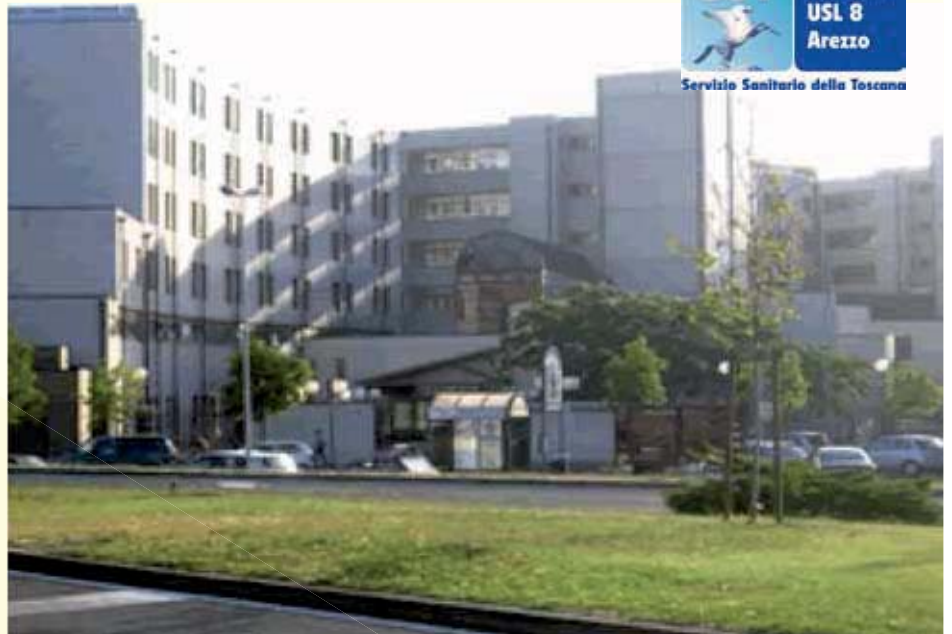
OSPEDALE SAN DONATO - AREZZO

Questo progetto ad altissima complessità è stato così reso "semplice" grazie all'impegno di tutte le persone coinvolte che ne hanno compreso l'importanza e l'utilità straordinaria per tutta la sanità della provincia di Arezzo e della Regione Toscana.