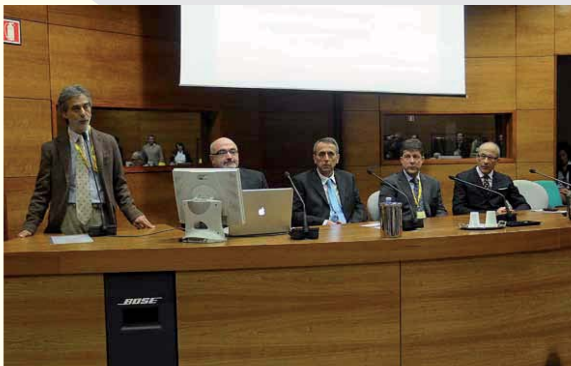
Auditorium Ospedale San Donato di Arezzo